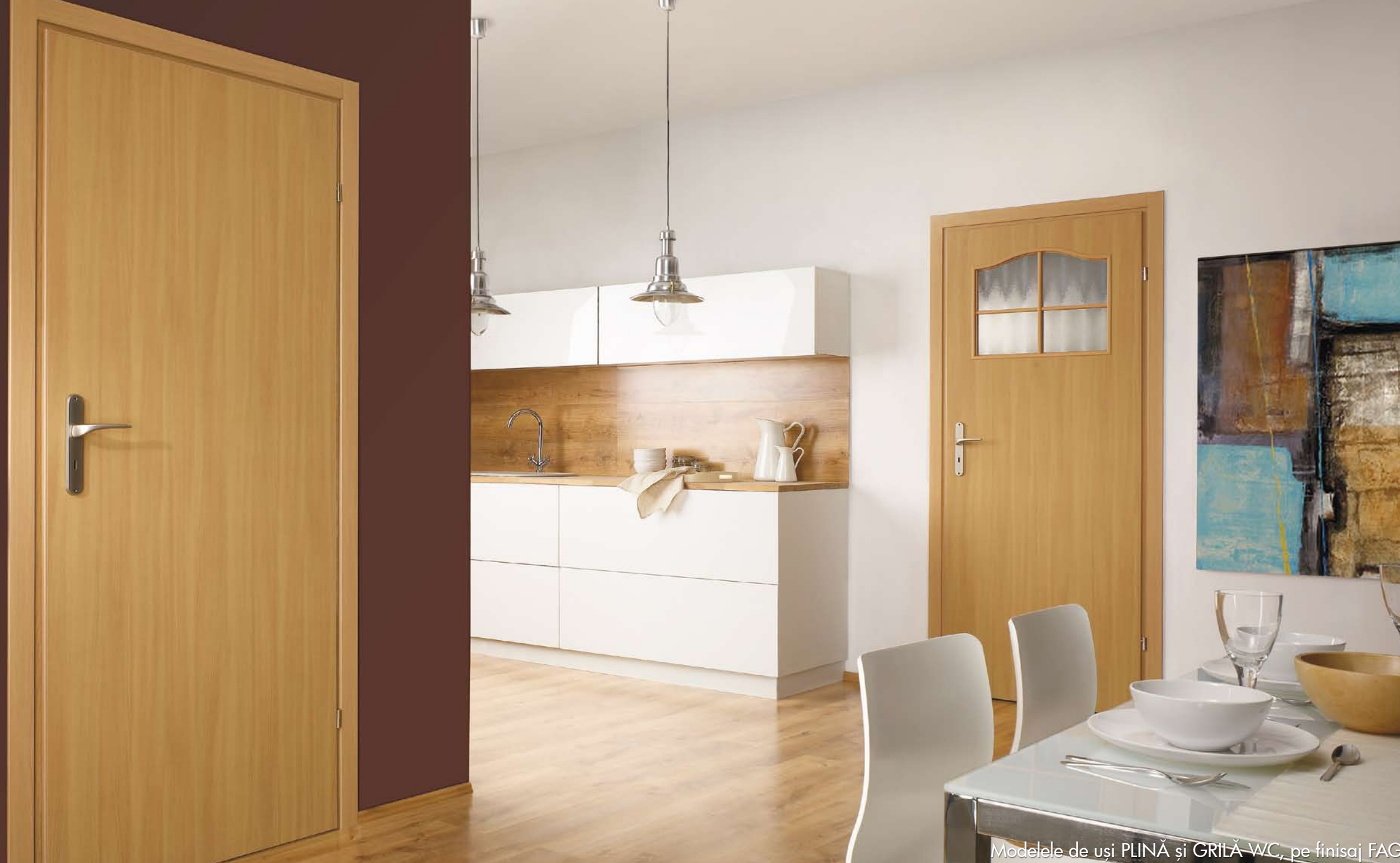
Modelele de uși PLINĂ și GRILĂ WC, pe finisaj FAG