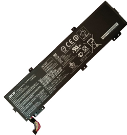
Genuine Batterie pour Asus C32N1516 58.83 €