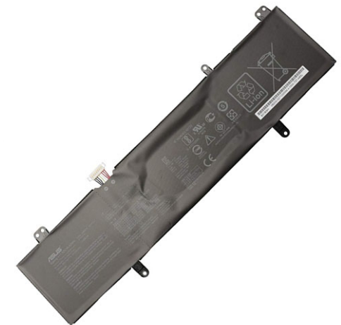
B31N1707 Original Batterie pour Asus 84.51 €