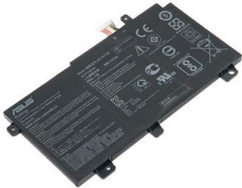
B31N1726 Batterie pour Asus 105.95 €